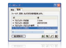
データビューアで、フィールド、 変数、および式の値を監視でき ます。